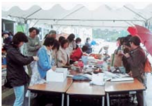
▲「さあ、いらっしゃい!!」昨年の大盛況の建学祭バザー