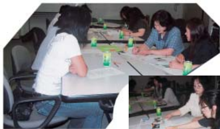
▲熱い意見を交換し黙々と編集する広報部員

今年度は、ベテランの広報担当の先生が退職(定年)され、一抹の不安がよぎったが、何とかなるものだ。広報部になっていただいた保護者の方、皆さんがこの仕事は若葉マークである。しかしながら、おおまかなご指導を担任の先生にしていた。そして、夢中になって作業が進む。そこから、上り下り待ち遠しい。プロから見れば稚拙なかもしれないが、全員満足のいくできあがりである。楽しんでいただけるとホッと安堵します。後期もよろしくお申し込みします。