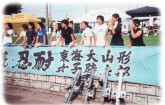
ガンバ東海 ガンバ東海

で臨み、普段の力が出せればインターハイという状況の中、これまた、力を出す事ができなかった。昨年のインターハイでは決勝進出と同記録で破れ、今年こそは、インターハイでの決勝進出を目標に掲げた分、力みすぎてしまったのかもしれない。今からは、足元を見据えて、一步一步、競技力の向上に努めたい。競技者のレベルによって差はあるが、精神面の強化が最後の勝敗のポイントになると思える。私は、選手一人ひとりの目標を大切にしている。それを深く考えるために練習日誌をつけさせている。考えながら練習する事で質を高め、意識を高めると思う。最後に「挑戦・強気・忍耐」の旗の下、陸上で培っている精神力を役立たせるためにも、何事にも挑戦する生徒であってほしい。