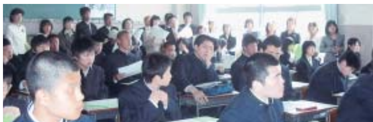
入学式後のクラス開きを見守る保護者(1年2組)

ついこの間、中学生になったと思っていたのに、もう高校生なんだね。受験中は大変だったよね。本当に入学おめでとう。長い人生において高校生活の3年間、ともするとあっという間に過ぎ去ってしまう。だけど、これからきっと様々な出会いを経験して、お互いに個性を認め合い切磋琢磨するなかで、きっと新しい自分というものを発見し、たくましくなっていくと信じています。勉強に部活動に果敢にチャレンジして、二度とない充実した高校生活を送ってください。