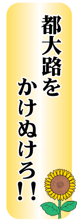
女子陸上競技部保護者会会長