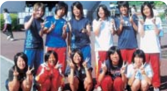
東北大会、十名の参加は過去最高